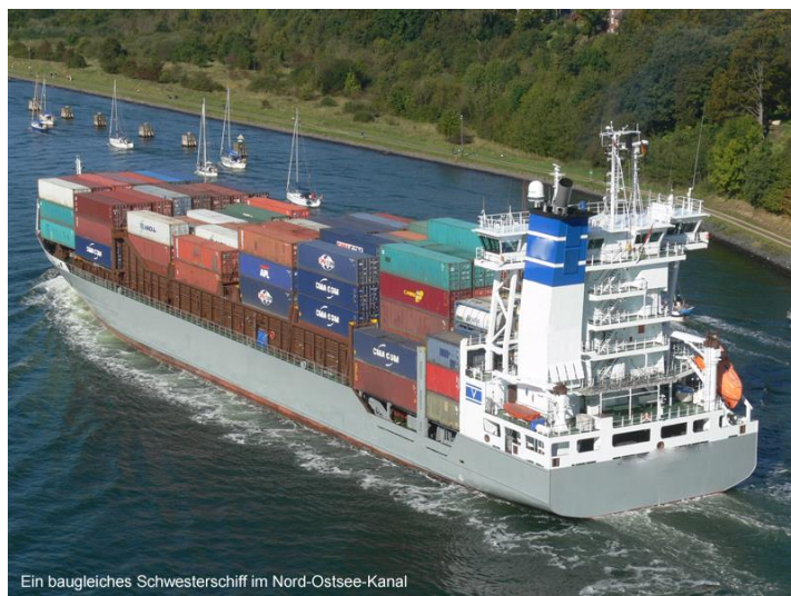
Ein baugleiches Schwesterschiff im Nord-Ostsee-Kanal

Containerschiff, Flagge Antigua, Nationalität des Kapitäns: international, Nationalität der Reederei deutsch, Baujahr